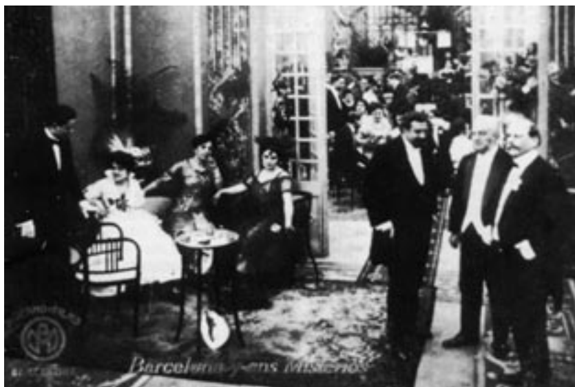
Una escena de Barcelona y sus misterios (1916).