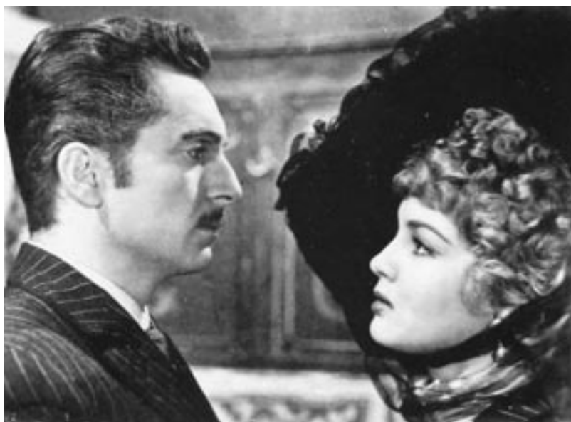
José María Seoane y Sara Montiel, en Mariona Rebull