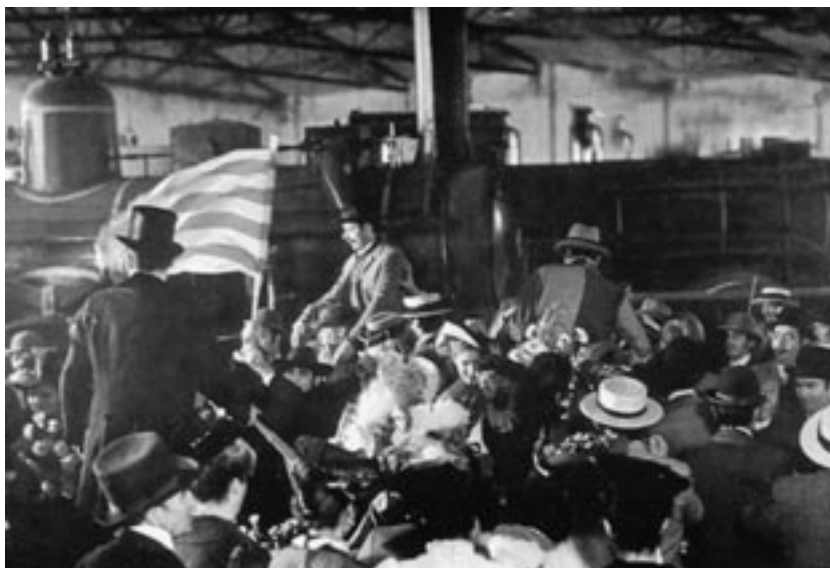
Una escena de La ciudad quemada (1976), de Antoni Ribas