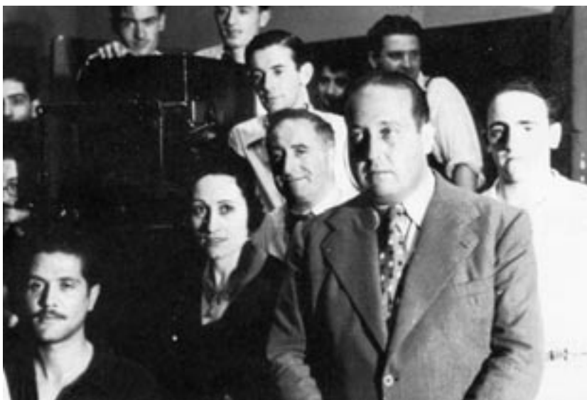
Durante de rodaje de El Cafè de la Marina (1933), película hablada en lengua vernácula