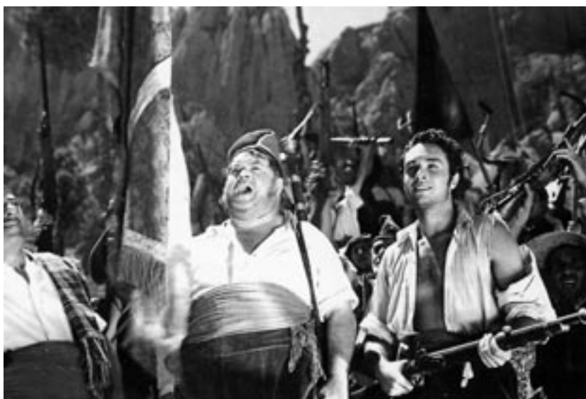
Plano de El tambor del Bruch (1948), de Ignacio F. Iquino